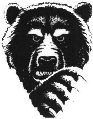
Grizzly (À suivre)