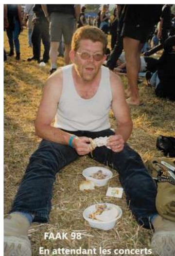
FAAK 98 En attendant les concerts