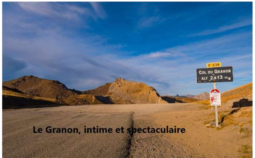
Le Granon, intime et spectaculaire