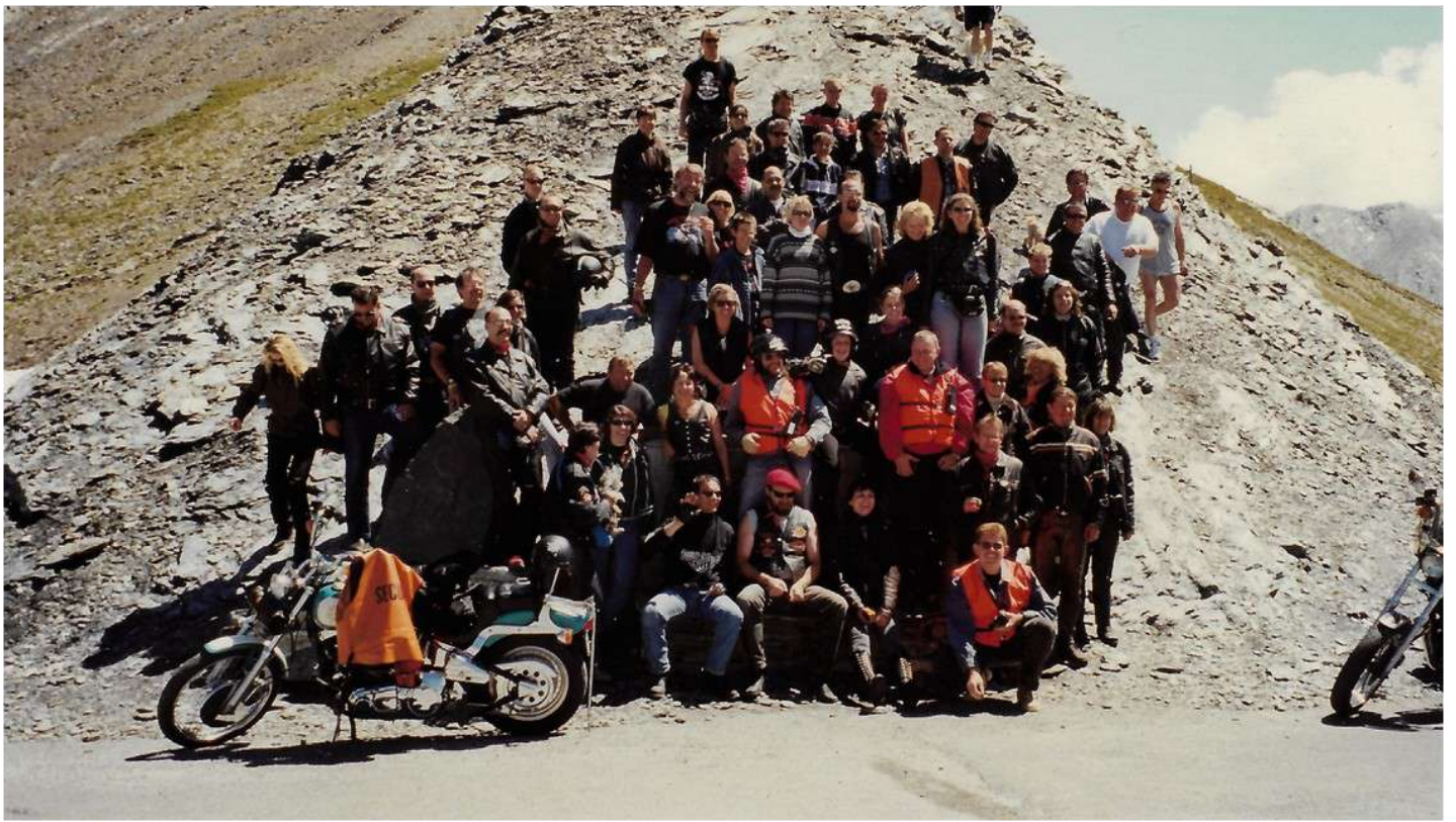
Photo de groupe au col Amiel à 2700m d'altitude. Ci-dessous 2 cols emblématiques pour le Chapter: Le Granon et Sarenne (1999m)