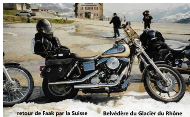
retour de Faak par la Suisse