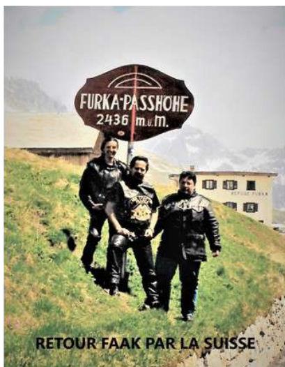
RETOUR FAAK PAR LA SUISSE