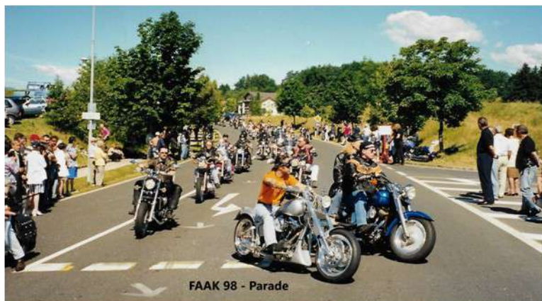
FAAK 98 - Parade